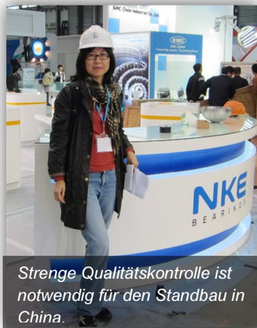
Strenge Qualitätskontrolle ist notwendig für den Standbau in China.

ist mit entscheidend für den Erfolg einer Veranstaltung. Einige Aussteller lassen die Messestände in China von europäischen Messestandbauern errichten. Dadurch wird, mit entsprechend hohen Kosten, die Qualität des Standes sichergestellt. Die Kosten für chinesische Messestandbauer sind, im Vergleich zu europäischen, deutlich geringer. Wirklich gute chinesische Messestandbauer verfügen u.a. über ausgezeichnete Kenntnisse, was örtliche Begebenheiten und Besucherverhalten betrifft. Dennoch ist eine permanente Kontrolle notwendig - vom Konzept, Budget, Konstruktionszeichnungen, bis hin zu den Aufbauarbeiten. Falls Sie über keine eigenen Mitarbeiter zur Überwachung des Messestandbaus vor Ort verfügen, müssten Sie mindestens 24 Stunden vor Messebeginn noch einmal alles persönlich kontrollieren. Dadurch sollte Ihnen noch genug Zeit für notwendige Anpassungen bleiben.